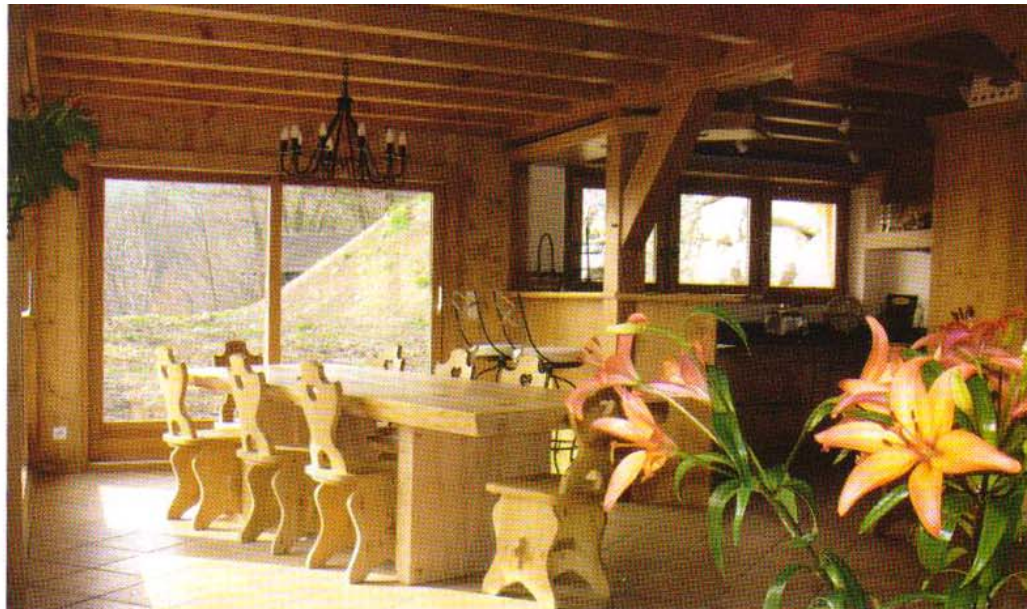
L'aménagement intérieur rend compte des efforts de conception, par la forte présence du bois, et par la clarté apportée par de larges ouvertures.

La piscine va utiliser l'eau de source captée sur